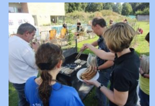
sei es am Grill