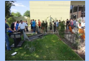
Für das leibliche Wohl wird besten gesorgt,