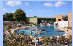
Mittagspause beim ISF