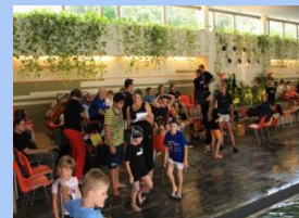
Der Familienbereich im ERKA-Bad