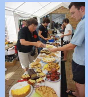
oder an der Salat- und Kuchentheke.